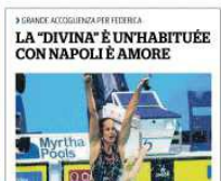
FEDERICA PELLEGRINI ALLA TERZA PARTECIPAZIONE AL GRAN PRIX - CITTÀ DI NAPOLI