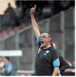
La stella Sarri lascia il Napoli dopo tre anni in attesa della decisione del rapporto con il club. L'agente si è affrettato a contatti con i Chelsea di proprietà del francese e sono stati annunciati i termini.