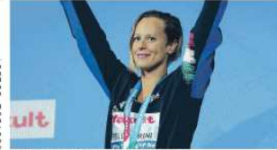
FEDERICA ALLA TERZA PARTECIPAZIONE AL GRAND PRIX - CITTÀ DI NAPOLI

Il titolo è di Federica Pellegrini. Non è il titolo di un libro, ma è il titolo della medaglia d'oro che parte oggi alla Scandone per l'ultima volta della giornata di domani.