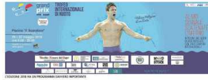
FEDERICA ALLA TERZA PARTECIPAZIONE AL GRAND PRIX - CITTÀ DI NAPOLI

Federica Pellegrini nella giornata di oggi nuoterà le sue specialità: i 100 stile libero e i 100 dorso.