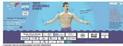
Federica Pellegrini nella giornata di oggi motterà le sue specialità a 1000 stile libero e 100 dorsale

Il titolo è di Federica Pellegrini. Non è il titolo di un libro, ma è il titolo della medaglia d'oro che parte oggi alla Scandone per l'ultima volta della giornata di domani.