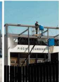
Palabarbuto e Piscina Scandone. Lavori a ritmo per il primo impianto. Quasi ultimato il secondo

GLI IMPIANTI DELLA PERIFERIA. Tra i cantieri più complessi c'è quello del Palabarbuto. Anche lì non si segnalano particolari ritardi sulla tabella di marcia, anzi si sta recuperando il tempo andato perso all'inizio, anche se è probabile che si ar-