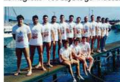
I protagonisti del Postipo con la maglia di "100"

Le magliette "100 days to go" indossate da tantissimi sportivi napoletani e italiani nelle diverse gare