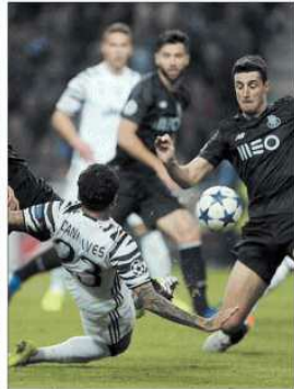
L'attesa gara Ko a Siviglia ma il Leicester resta in corsa