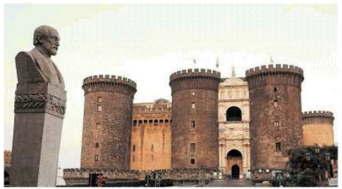
Il Maschio Angioino in uno dei locali di proprietà della Fondazione Valenzi, dedicata al sindaco dei tempi del terremoto scomparso nel '64. Sotto: un altro di Palazzo

La Fondazione Valenzi di Maschio Angioino, il canile La Fenice di Ponticelli, la biblioteca La Città del Sole nell'ex Asilo Filangieri. Si allarga l'inchiesta della Corte dei Conti sul patrimonio immobiliare del Comune concesso a privati a prezzi irrisori o gratis, mentre la legge prevedeva uno sconto massimo del 50%. Nel mirino della magistratura contabile ci sono anche i circoli per anziani, come l'Arco di via Pietro Castellino, associazioni impegnate nell'educativa territoriale come il Centro Ester di Barra, il Centro Lima dei volontari della Protezione Civile a Soccavo o la palestra di arti marziali Kodokan di piazza Carlo III.