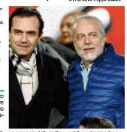
Napoli. Dopo la sconfitta di Madrid si è creata una spaccatura tra il presidente e il tecnico e la squadra. Don Aurelio, infatti, non gradì il suo contro i campioni d'Europa e decise di attaccare il tecnico dicendo che non utilizzava gli uomini giusti al posto giusto. Un affronto che anche i tifosi si sono legati al dito. E anche lo stesso primo cittadino.

NAPOLI. Gaetano Luigi de Magistris, il sindaco di Napoli "code" per la spaccatura all'interno del Pd. Quel partito che nelle ultime elezioni comunali aveva fatto di tutto per farglielo perdere. Alla fine, però, Grillo ha bastato tutto al ballottaggio riprendendosi nuovamente la città. Ecco, quindi, che prova a snobbare ciò che succede nel giardino a fianco tirando in ballo il calcio. E specificamente il