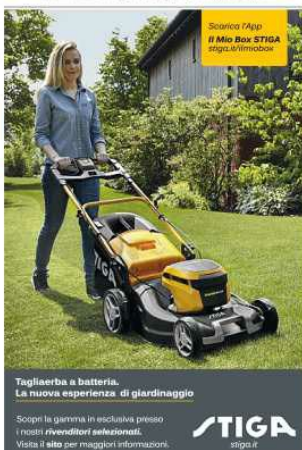
Togliettaba a batteria. La nuova esperienza di giardinaggio

Scopri la gamma in esclusiva presso i rivenditori autorizzati. Visita il sito per maggiori informazioni.