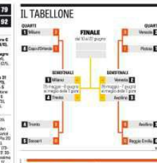
SEMIFINALI: GARA I GIOVEDÌ