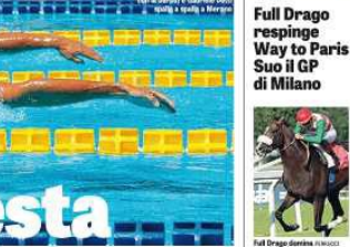
Full Drago respinge Way to Paris. Suo il GP di Milano