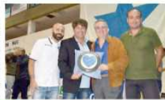
La dirigenza del Cuore Napoli Basket

INTANTO SUL CAMPO, ancora una bella e autorevole affermazione per il Cuore Napoli Basket, che si è confermato bello e vincente anche nella seconda semifinale consecutiva sfer-