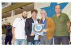
La dirigenza del Cuore Napoli Basket

INTANTO SUL CAMPO, ancora una bella e autorevole affermazione per il Cuore Napoli Basket, che si è confermato bello e vincente anche nella seconda semifinale consecutiva sior-