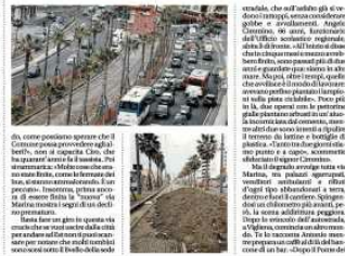
Le buche e i disagi di Via Marina tra degrado e lavori fermi. In alto: la strada di legno della città

Latella: «Universiadi, un mese per avviare tutte le gare»