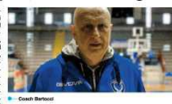
stessa del campionato di A2 entro la fine della stagione regolare (20 aprile), con la società partenopea, che invece di retrocedere direttamente in serie B, disputerebbe i prossimi play-off da fine aprile, per la permanenza nella seconda serie del basket al maschile nazionale.

NAPOLI. Anticipo del 10° turno di ritorno del girone Ovest di A2 maschile, per la squadra del Cuore Napoli Basket sul parquet della Dinamo Cagliari, questa sera alle ore 20.30. Ad attendere, Turner e compagni, ci sarà il PalaFischetti. Il seano locale maschile, 11° in classifica, reduce dal blitz sul parquet della Virtus Roma, ed allungo da coach Riccardo Paoletti. Koone, osteso molto positivo (18 punti di media a partita), il giovane pivot statunitense di grande prospetto, Stephen, il cestista Rullo (ben 28 punti con Roma), ferspetta ad Allegretti (poi volta Napoli), e gli emergenti Baccelli e Tanti, oltre all'ex di turno, il pivot Matteo (la scorsa stagione a Napoli), sono i giocatori di maggiore spessore tecnico della squadra napolese, che ha anche ingaggiato l'esteso statunitense di possaporto irlandese, McCann, per un ruolo di disposizione. Arbitreranno la partita sul parquet del capoluogo sardo i signori, Caputo di Reggio Calabria, Fori di Milano e Del Greco di Verona. Il Cuore Napoli, che vince il match d'andata con i sardi, 94-91, continua anche a seguire con interesse gli sviluppi dell'archista aperta e la procura federale della Fip sulla vicenda Reggio Calabria (per ora ancora nella fase istruttoria con varie audizioni), in merito ad alcuni presunti illeciti amministrativi imputati al club calabrese e che potrebbe portare a bene al declassamento della stessa società e anche all'uscita dell'iscrizione successiva della