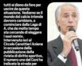
Il presidente del Cagliari Tommaso Galati

Il club ha affidato il compito di studiare un nuovo impianto che sia una vera e propria casa per i rossoblù. Un progetto che si realizzerà in tre fasi: la prima, la seconda e la terza.