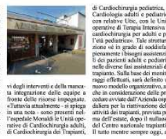
di Cardiologia pediatrica e pediatrica con relative Uilc, con le Unità operative di Trapianti Intensivo di cardiocirurgia per adulti e per i trapianti pediatrici. Tale struttura è in grado di soddisfare pienamente i bisogni assistenziali dei pazienti adulti e pediatrici nelle diverse fasi assistenziali del trapianto. Sulla base dei monitoraggi effettuati, sarà definito un nuovo modello organizzativo, anche in considerazione delle proposte delle risorse impegnate.

NAPOLI. Una riunione finalizzata alla definizione di un modello organizzativo integrato che metta insieme le migliori professionalità dell' Unità operativa di Cardiologia pediatrica e della Cardiologia di trapianti è stata convocata oggi presso l' Azienda ospedaliera dei Colli di Napoli, «in merito alla problematica dei trapianti cardiaci e dell' assistenza ai trapiantati in età pediatrica». Ad annunciare la Direzione Salute della Regione Campania e il Centro regionale trapianti, «a supervisione dei trapianti pediatrici, com' è noto, è stata decisa un anno fa dal Ministero della Salute a seguito dell' accertamento degli otto negati-