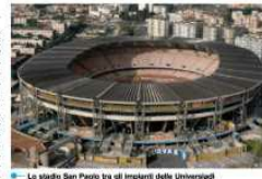
Lo stadio San Paolo tra gli impianti delle Universiadi