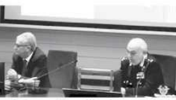
Un momento dell'incontro di biotecnologia

Sono state illustrate metodiche innovative di cardiologia nella diagnosi di lesioni muscolari, cardiache, della corda. Rimane in grado di diagnosticare i miscelati senza ricorrere all'innervazione di una biopsia miocardica. Nel campo della riabilitazione il dottor Napoli, fissato dell'ospedale poliziotto partenopeo, Samobono, ha mostrato come nel suo reparto sia stata avviata la riabilitazione robotica, una sofisticata procedura che permette il recupero da un infarto grave che fino a qualche anno fa non lasciava spazio ad un ritorno alla normalità. A parlare poi di problematiche sociali che lo sport aiuta a risolvere, ma anche le malattie che possono alterare i valori sportivi, problemi di non accreditata importanza, sono intervenuti autorevoli professori di varie discipline: medici, fisioterapisti, psicologi e c'è stato un intervento anche del questore di Napoli, Antonio De Luca.