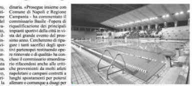
La piscina Scandone prima della chiusura per i lavori