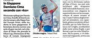
Octave maglia. Nibali vince