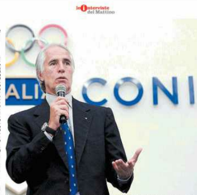
Larabba: il presidente del Coni Malagò con il ministro della Cultura D'Alema. In basso: il governatore della Campania De Luca, la conferenzieri del campionato di calcio a 5, il calciatore nominato referente del Coni