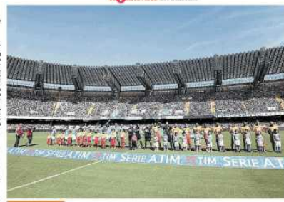
I grandi progetti Dopo il flop Roma 2024, in Campania il primo prestigioso evento «Riforme del calcio e Universiadi così parte il rilancio dello sport»

«È un' area che sarà a disposizione di tutti, non solo per la manifestazione ma anche per il futuro della città».