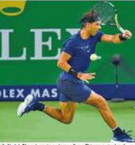
Rafa Nadal, 31 anni, punta a vincere il 7° torneo stagionale

Il duello è diventato tra Rafael Nadal e Roger Federer. Il duello è diventato tra Rafael Nadal e Roger Federer. Il duello è diventato tra Rafael Nadal e Roger Federer.