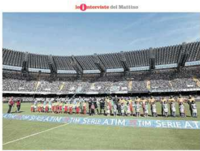
I grandi progetti Dopo il flop Roma 2024, in Campania il primo prestigioso evento «Riforme del calcio e Universiadi così parte il rilancio dello sport» Il ministro Lotti: l'evento del 2019 lascerà il segno a Napoli

Sono certo che la Regione Campania adotterà tutti gli strumenti affinché sia fatta un'ottima figura nel 2019. Noi saremo lì a monitorare, con occhio attento e vigile. Servirà la collaborazione di tutti, a prescindere dai colori politici. Abbiamo preso un impegno con il presidente della federazione mondiale