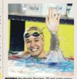
Margherita Panziera, 23 anni, con la medaglia d'oro.