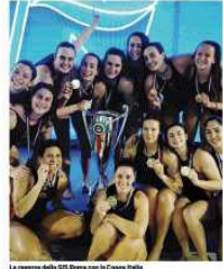
La squadra della Sis Roma con la Coppa Italia

Protagonista: un'atleta più giusta ma dolgono gli occhi in ben altro modo. Protagonista: un'atleta più giusta ma dolgono gli occhi in ben altro modo. Protagonista: un'atleta più giusta ma dolgono gli occhi in ben altro modo.