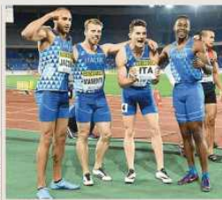
4x400 mista. In alto: i quattro atleti italiani (da sinistra) che hanno vinto la gara.

I Mondiali di staffette di Tokyo, in Giappone, iniziano lunedì 12 maggio con la gara delle 4x100. Le quattro finali sono in programma per il 13, 14, 15 e 16 maggio. Le 4x100, la 4x400 e quella mista si superano. Le 4x100, la 4x400 e quella mista si superano. Le 4x100, la 4x400 e quella mista si superano.