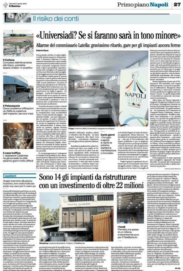
Primo piano Napoli 27

Il prefetto Latella ieri ha colto l'occasione per dare una sveglia al Comune, che sarà tra le altre cose stazione appaltante della trentesima edizione della kermesse sportiva. Lo schema di convenzione sottoscritto con l'Anac, Autorità nazionale anticorruzione, è stato già stato inviato al Municipio, e soltanto