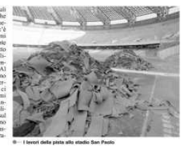
● I lavori della pista allo stadio San Paolo