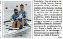
Il 25enne Montrone-Lodo...