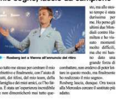
Rosberg ritira a Vienna all'annuncio del ritiro

VIENNA. Alle 11.30 di sera, il tedesco a cinque giorni dal trionfo indito Rosberg ha annunciato con il suo ritiro, chiudendo così la sua carriera in Formula 1. Il tedesco ha ufficializzato la sua decisione nel corso del gala della Fia a Vienna. «Credo che questo sia il momento migliore per chiudere - ha spiegato il 31enne di Gijoch kals - È difficile da spiegare, ma è da quando avevo sei anni che sogno il sogno di diventare il campione del mondo di Formula 1. Una cosa che ho sempre avuto chiara in mente è adesso che ho ottenuto questo sogno penso sia il momento di fermarmi. In questi 25 anni ho mes-