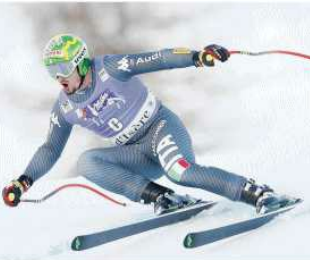
Domme Paris, 27 anni, all'attacco, nel superG francese da conquistare il suo 10° podio di Coppa del Mondo

Due esport nel nord estagionale della velocità e sono gli uomini più azzeccati in appena otto gare da domani a lunedì. Oggi il sole alla discesa DISCESA L'Italia va veloce nel nord estagionale della velocità e sono gli uomini più azzeccati in appena otto gare da domani a lunedì. Oggi il sole alla discesa